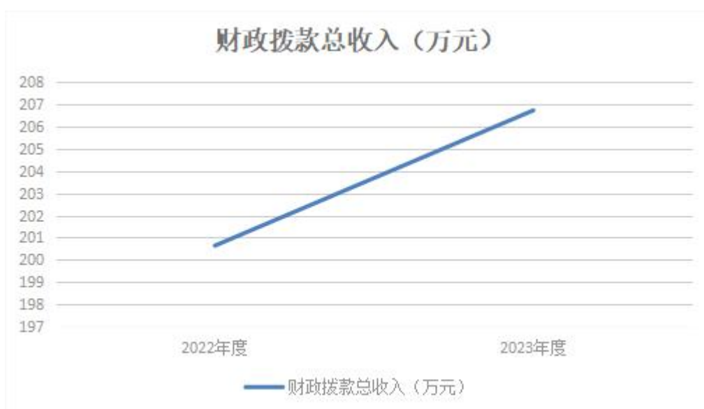
图4：财政拨款收、支决算总计变动情况

2023年度财政拨款收入中，一般公共预算财政拨款收入206.73万元，比2022年度决算数增加6.09万元。增加主要原因是追加新进人员工资福利。政府性基金预算财政拨款收入0万元，比2022年度决算数增加0万元。增加主要原因是无。国有资本经营预算财政拨款收入0万元，比2022年度决算数增加0万元。增加主要原因是无。